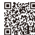
佐賀県信用保証協会HP

<お問い合わせ先> 佐賀県信用保証協会 企画総務部 企画総務課 0952-24-4340