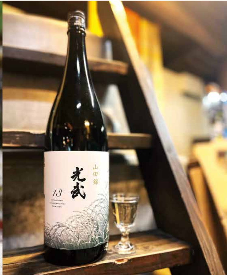
光武酒造場/写真右

1934年創業。一人娘が幸せに育つようにとの願いを込めて名付けられました。佐賀県産米を使用した食中酒として楽しめる純米酒をメインに製造しております。